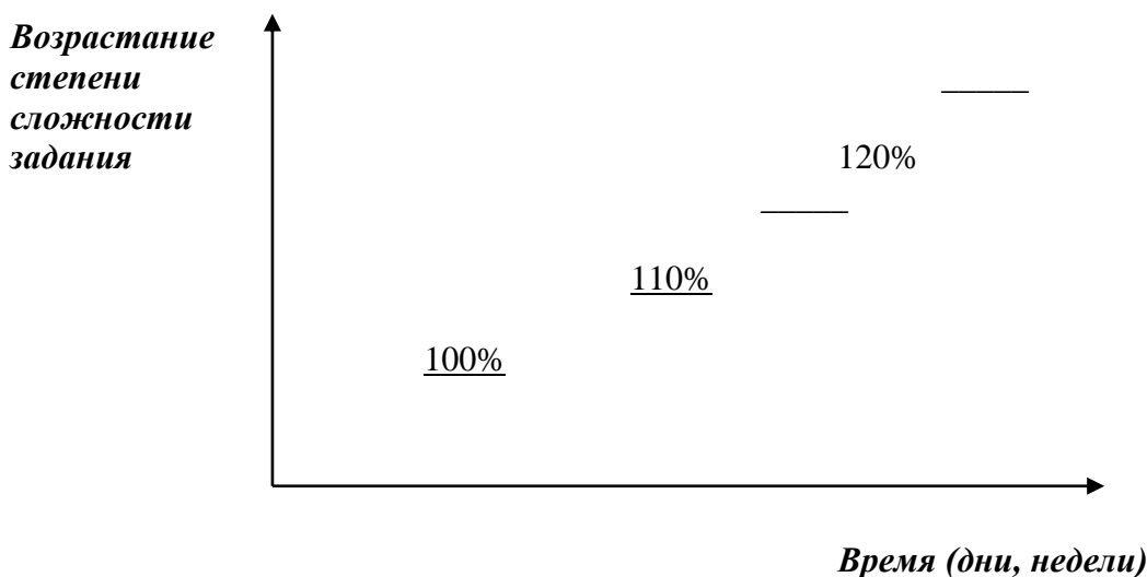
Рис.1. Формирование мотивации достижения рабочего. (Источник: Кравченко А.И. Социология менеджмента: Учеб. пособие для вузов. – М.: ЮНИТИ, 1999, С. 350.)

55. Определите принадлежность данной теории к определенной школе. Дайте краткое резюме по данной теме.